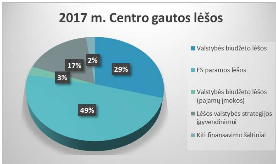
1 pav. 2017 m. Centro gautos lėšos