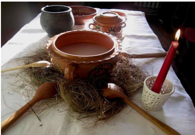
Nr. 5 _____ Kūčios