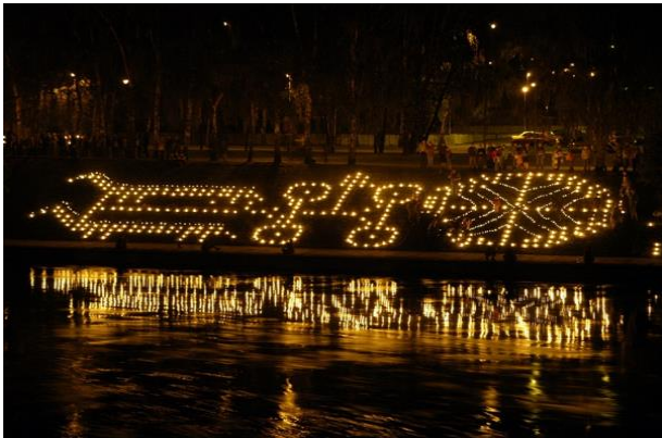
Nr. 3 _____ Rudens lygiadienis