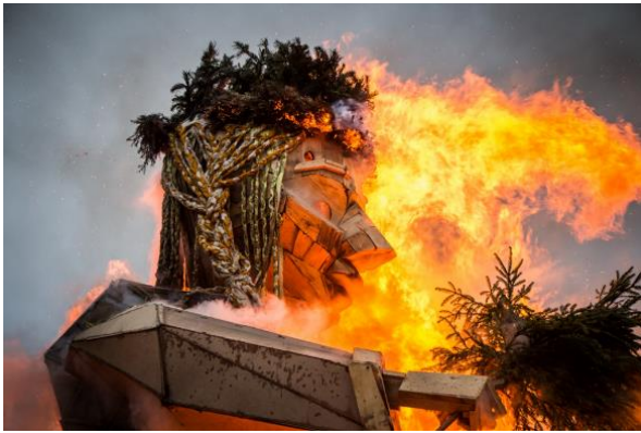
Nr. 1 _____ Užgavėnės

8. Kokią kalendorinę šventę simbolizuoja šie paveikslėliai? Įrašykite šventės pavadinimą prie paveikslėlio numerio: Joninės, Užgavėnės, Sekminės, Velykos, Rudens lygiadienis, Kūčios: