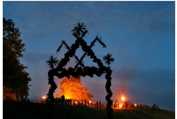
Nr. 2 _____ Joninės (Rasos, Kupolė)