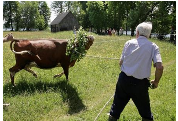
Nr. 4 _____ Sekminės