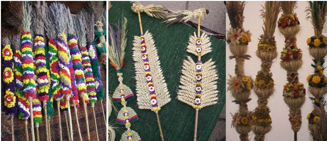
1. Volelinė (kiliminė)