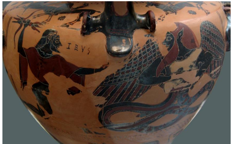
iv. Tifonas/ Tifoėjas – Dzeusas