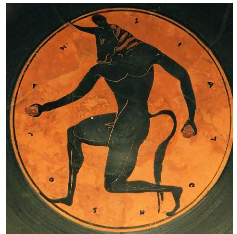
vii. Minotauras – Tesėjas

Vertinimas: Už kiekvieną teisingą atsakymą 1 taškas (daugiausia 7).