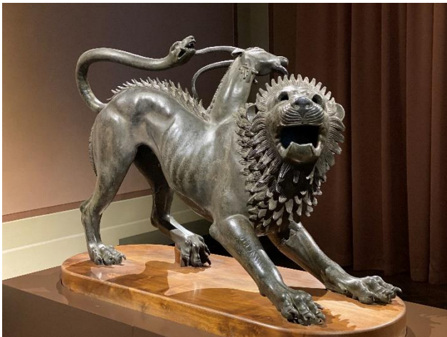
iii. Chimaira – Belerofontas