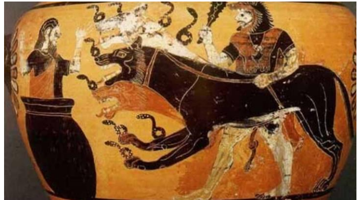
ii. Kerberos – Heraklis