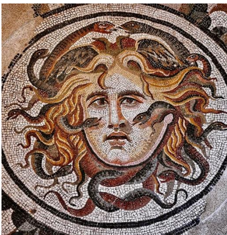
v. Medūsa Gorgonė – Persėjas