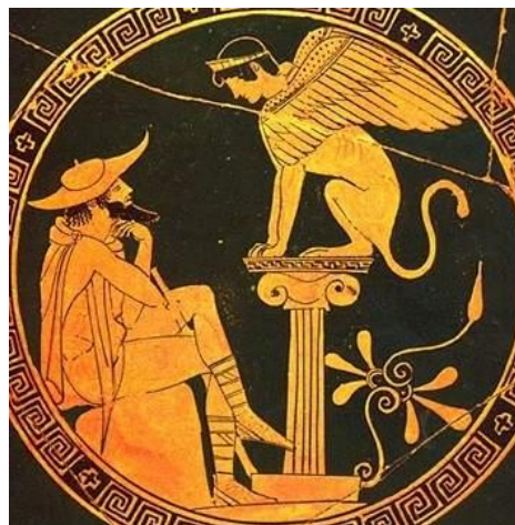
vi. Sfingė – Oidipas